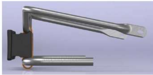
PHOTOS VUE DE DEVANT, DE DESSUS ET DE COTÉ, DU KIT DE MONTAGE CARENAGE AVANT AVEC SUPPORTS